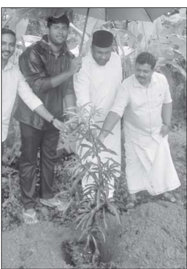
ജൂൺ 5 ലോക പരിസ്ഥിതി ദിനത്തോടനുബന്ധിച്ച് കൊല്ലം മെത്രാസന യുവജനപ്രസ്ഥാനം കല്ലട മേഖലയുടെ ആദിമുഖ്യത്തിൽ പുത്തൂർ എസ്.എൻ പുരം കുടുംബാരോഗ്യ കേന്ദ്രത്തിൽ പരിസ്ഥിതി ദിനഘോഷവും, തെ നടീലും ആരാമ്2 സംഘടിപ്പിച്ചപ്പോൾ.

മനുഷ്യഹൃദയം ഒരു വയലാണ്, ജീവിതം യാത്രയാണ്. കൂടിൽ നിന്നിറങ്ങി, കൂട്ട് തേടി, ദേശാന്തരിയായി നടക്കുന്ന മനുഷ്യൻ, തന്റെ ഉള്ളിൽ എന്ത് വളർത്തുന്നു എന്നതിലാണ് അവന്റെ ഭാവി നിൽക്കുന്നത്. നിശബ്ദമായി പിറക്കുന്നവയാണ് ഒരുദിവസം നമ്മുടെ ജീവിതത്തിന്റെ ശബ്ദമാകുന്നത്. അവയുടെ രൂപം നാം തിരഞ്ഞെടുക്കുന്നു. വിശ്വാസത്തിന്റെ പ്രകാശമാകുമോ, അല്ലെങ്കിൽ നമ്മുടെ സ്വന്തം ഇരുളാകുമോ എന്നത്.